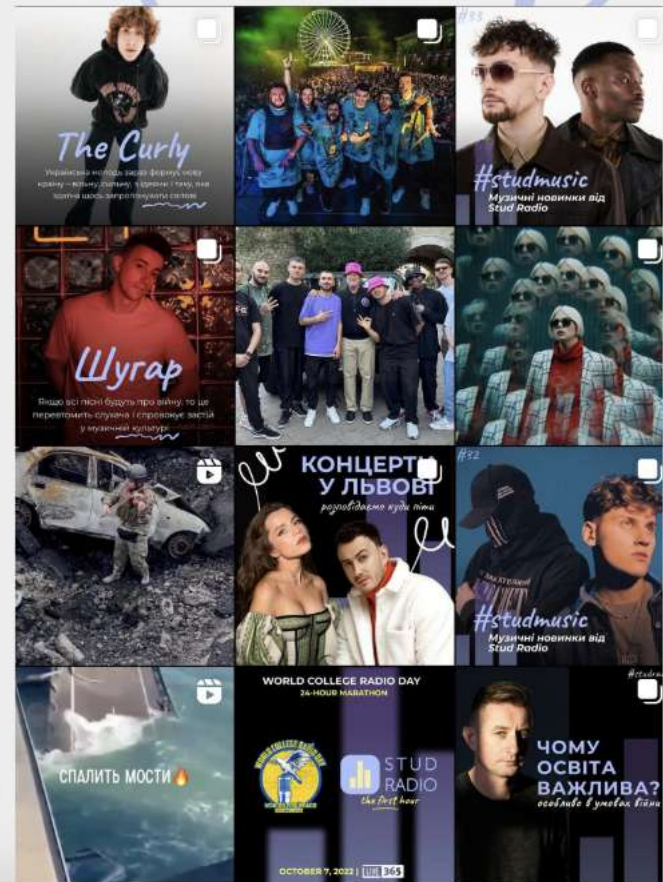
Япі Острів Суші